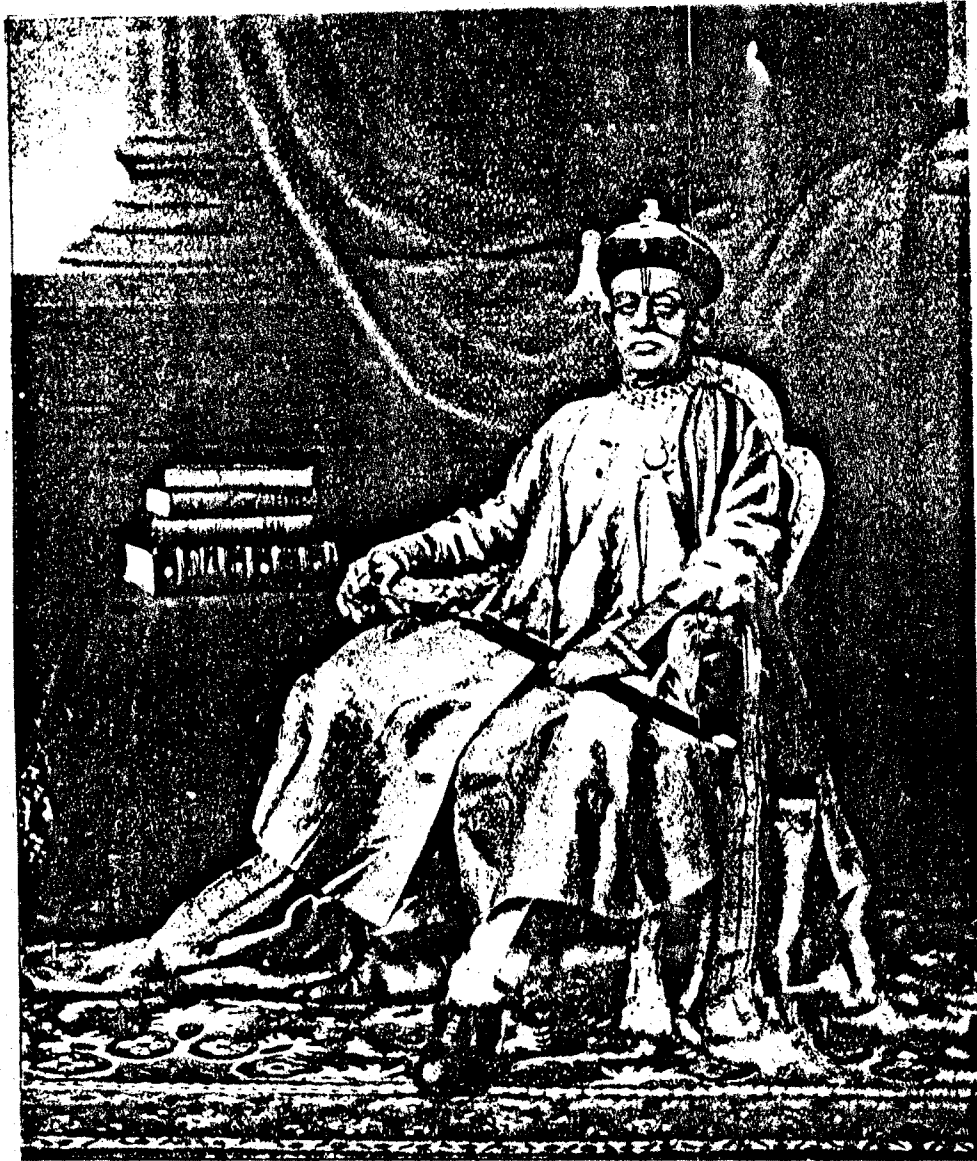
Shrimant Bhawanrao Shrinivasrao alias Bahasahob Pant Pratinidhi B. A., Ruler of Aundh.