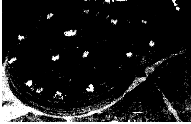
(छायाचित्र क्र. १ : माणकेश्वर येथील शिवलिंग)