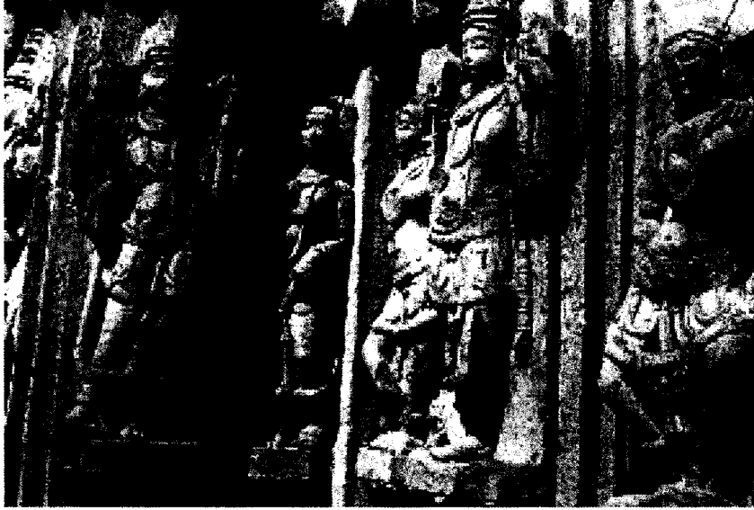
(छायाचित्र क्र. ४ : शिवमंदीरावरील कोरीव मूर्तीशिल्प)