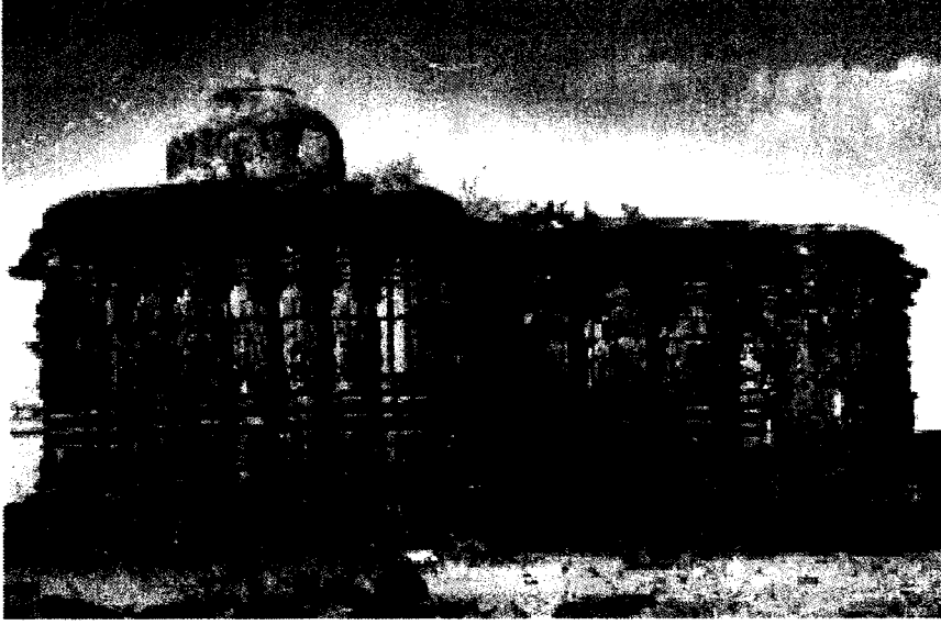
(छायाचित्र क्र. ३ : शिव - सटवाई मंदिराचे छायाचित्र)