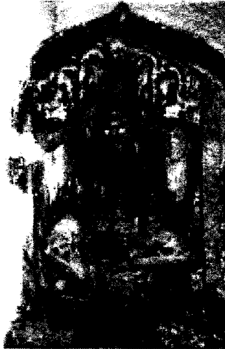
(छायाचित्र क्र. २ : सटवाईची पाषाण स्वरूपातील मूळ मूर्ती)