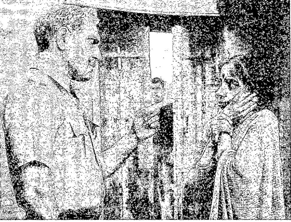
कॉन्स्टेबल वेलणकर (अनंताचे वडील) पत्नीस मारहाण करताना