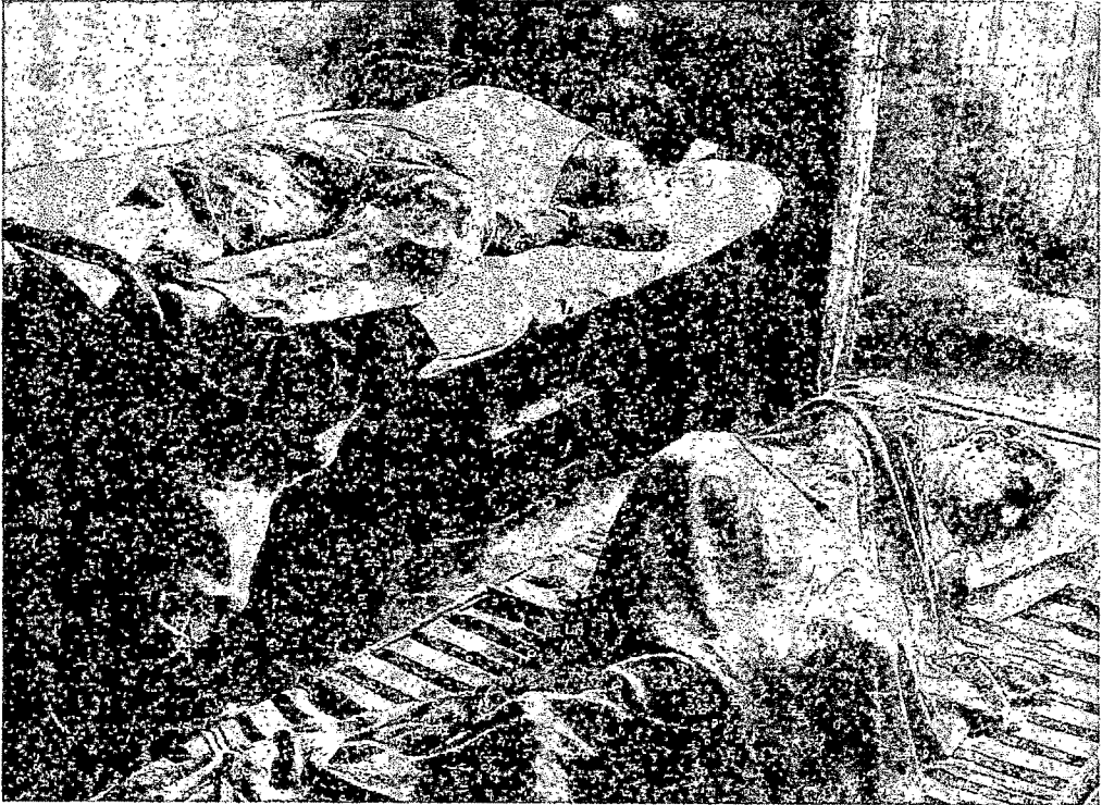
कथेचा चित्रपटातील शेवटचा प्रसंग