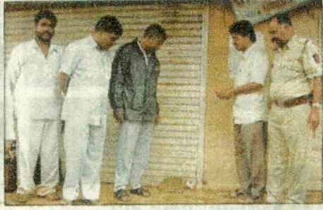
मुम्बेवाडी : कागदपत्रांची तपासणी करताना पोलिस व महसूल खात्याचे अधिकारी. दुसऱ्या छायाचित्रात स्वस्त धान्य दुकानाला सील लावताना पोलिस.