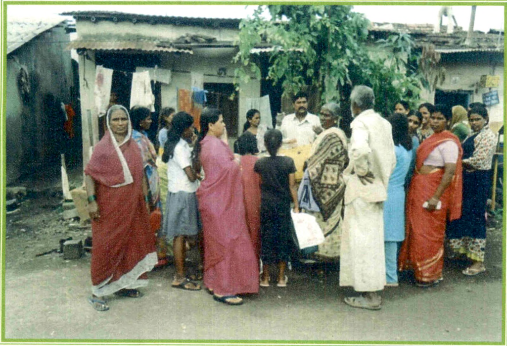
रेशन दुकान उघडण्यापूर्वी कार्डधारकांची गर्दी