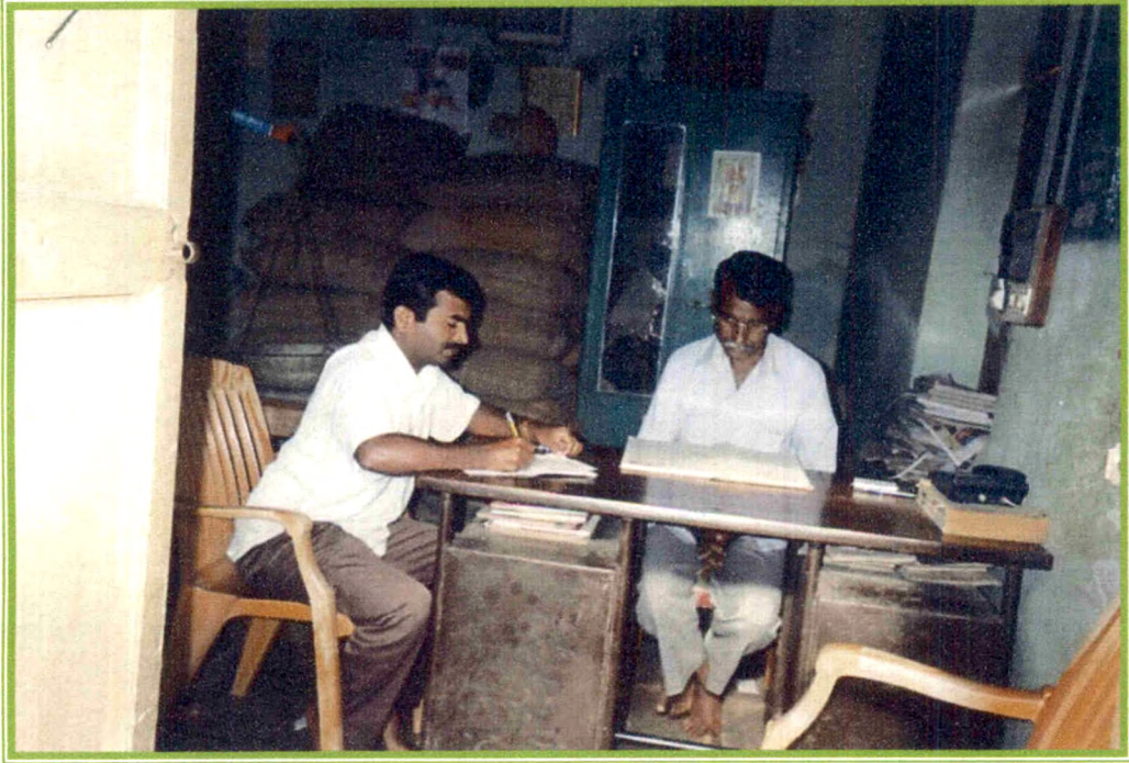
रेशन धान्य दुकानदाराकडून तथ्य संकलन