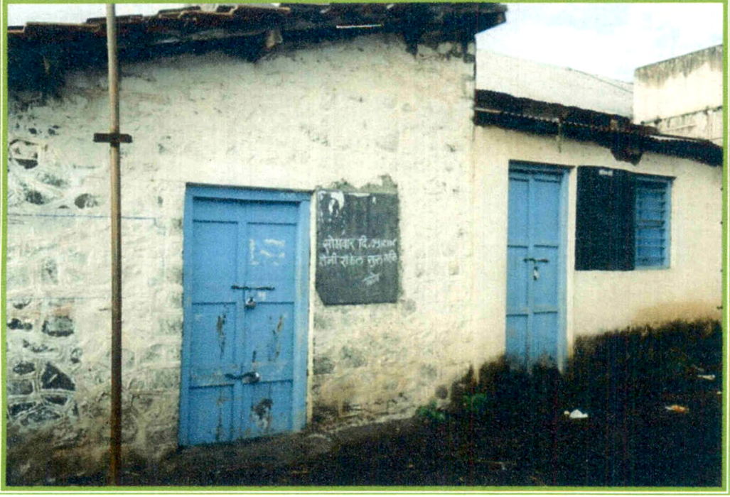
रॉकेल विक्रीबाबतची पूर्वसूचना देणारी नोटीस