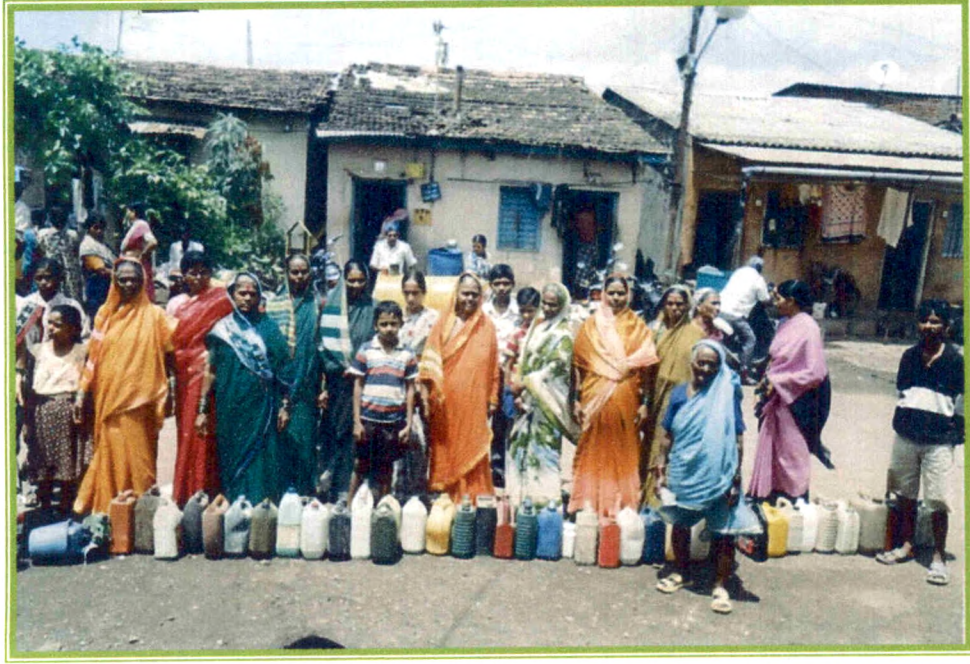
रॉकेलच्या प्रतिक्षेसाठी नागरीकांची रांग