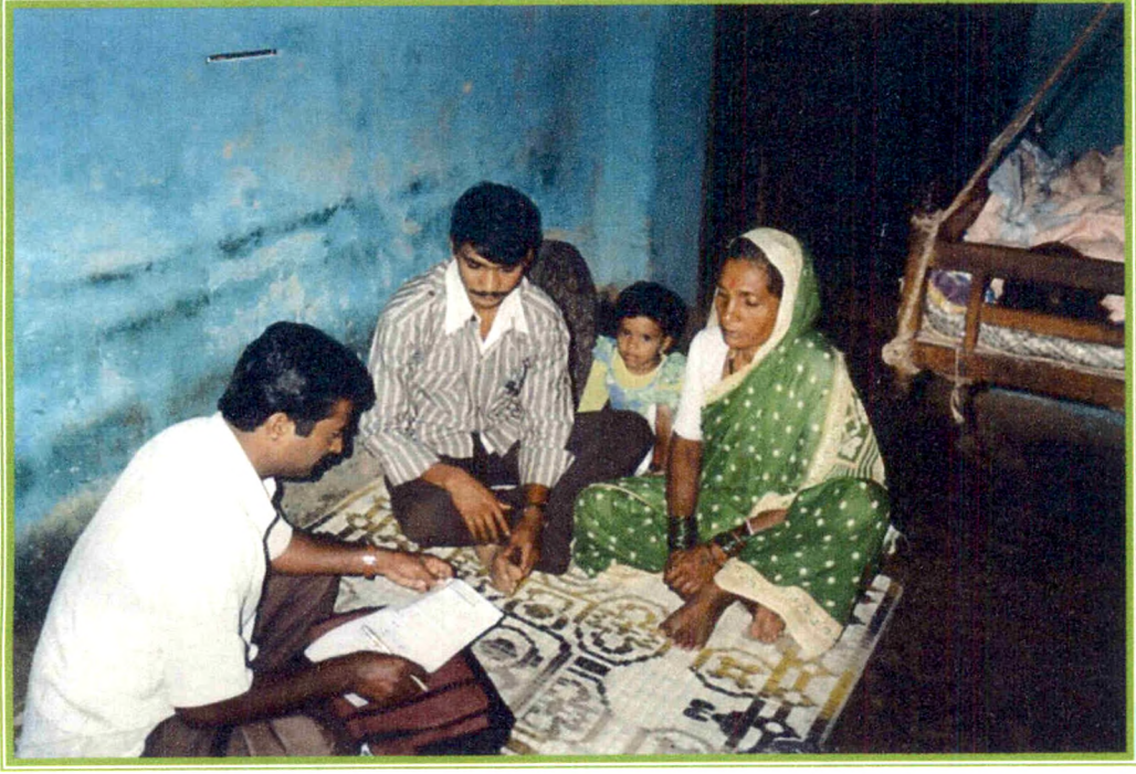
घरोघरी भेटी देऊन तथ्य संकलनात मग्न असलेला संशोधक व कार्डधारक नागरीक