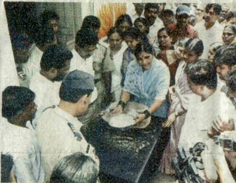
बोरोडगुप्ता : तोंदळातील पेशवाईसंदर्भात साम्याची समाजवादी पक्षातर्फे आंदोलन करण्यात आले. सहा पुरुषां अघिकाऱ्यांना भेटून तोंदळाचा मुद्दा सादरवताना महिला.