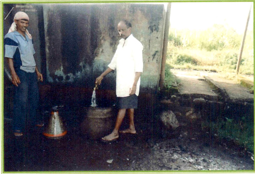
रॉकेल वाटप - यातच होतो घोटाळा