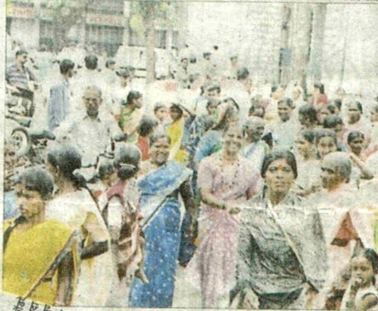
'रेशनवर स्वच्छ धान्य मिळावे' या मागणीसाठी जिल्हा मोलकरीण वतीने शुक्रवारी प्रभारी निवासी उपजिल्हाधिकाऱ्यांना निवेदन देण्यात आले. आलेल्या महिला.