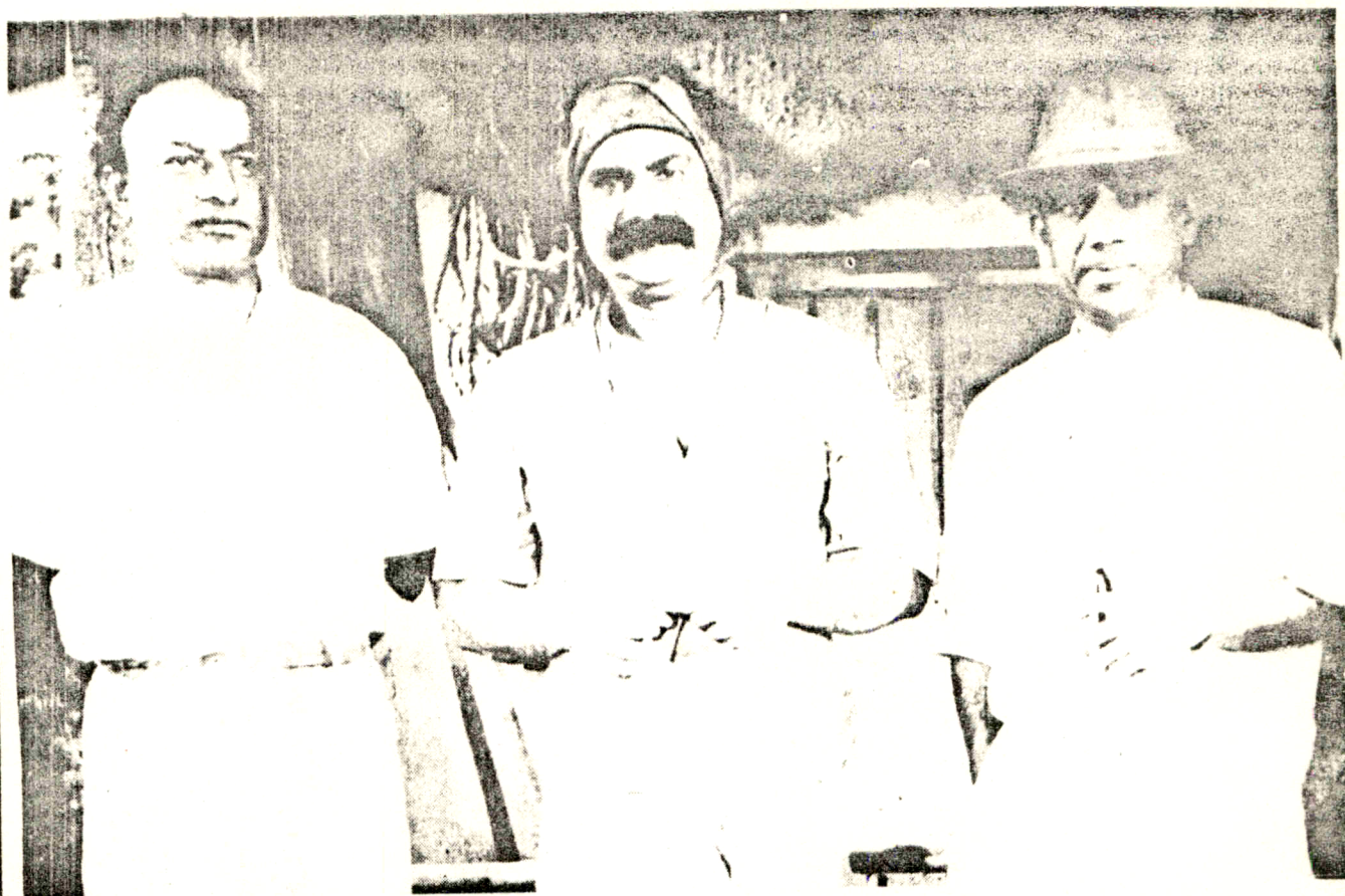
मराठी 'बोल'पटा युगाचे पहिले शिल्पकार डॉ. व्ही. शांताराम, बाबूराव पेढारकर, भालजी पेढारकर : जयप्रकाश स्टुडिओतील सेटवर.