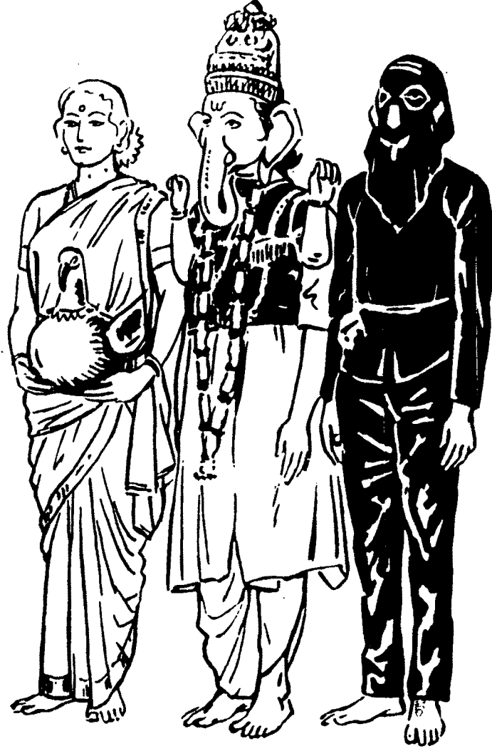
दशावतारः सरस्वती , गणपती , संरवासूर