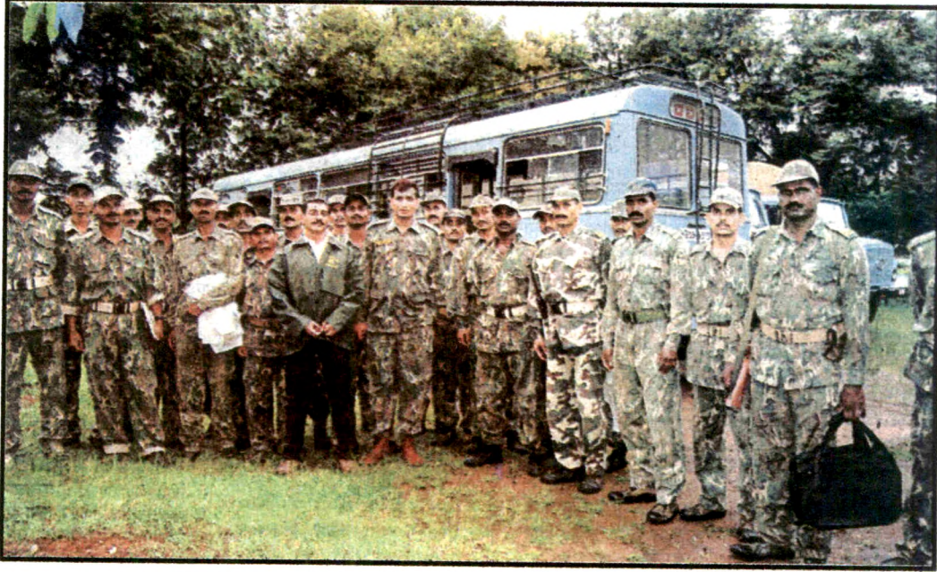
पुरग्रस्त भागात मदत कार्यासाठी आलेले जवान