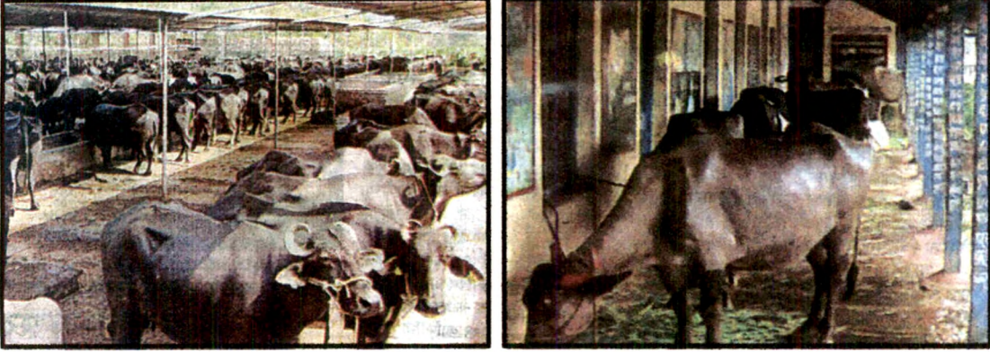
पुरग्रस्त भागातील विस्थापित जनावरे