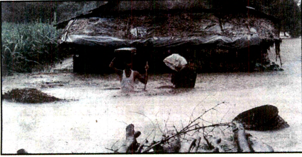
पुरग्रस्त लोक स्थलांतर करताना