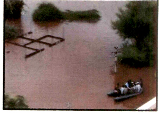
पुरग्रस्त लोकांचे सुरक्षित स्थळी स्थलांतर करताना