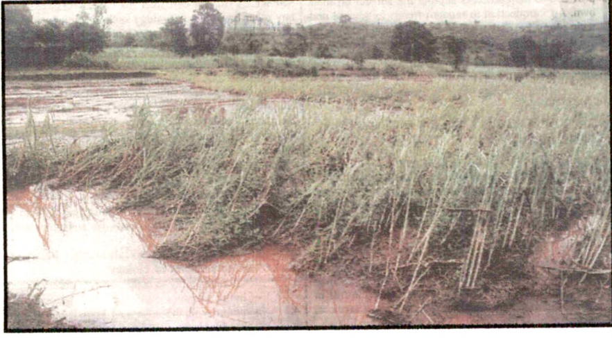
पुराच्या पाण्याने शेती पीकाचे झालेले नुकसान

वाळवा आणि शिरगांवातील पुरपरिस्थितीची छायाचित्रे