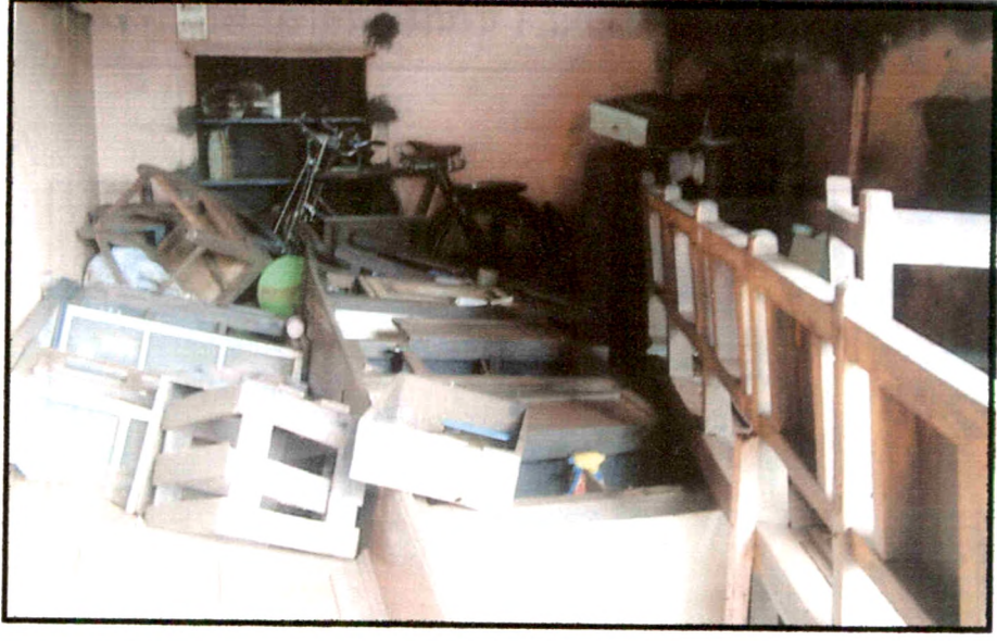
पुराच्या पाण्यामुळे घरातील वस्तुंचे झालेले नुकसान