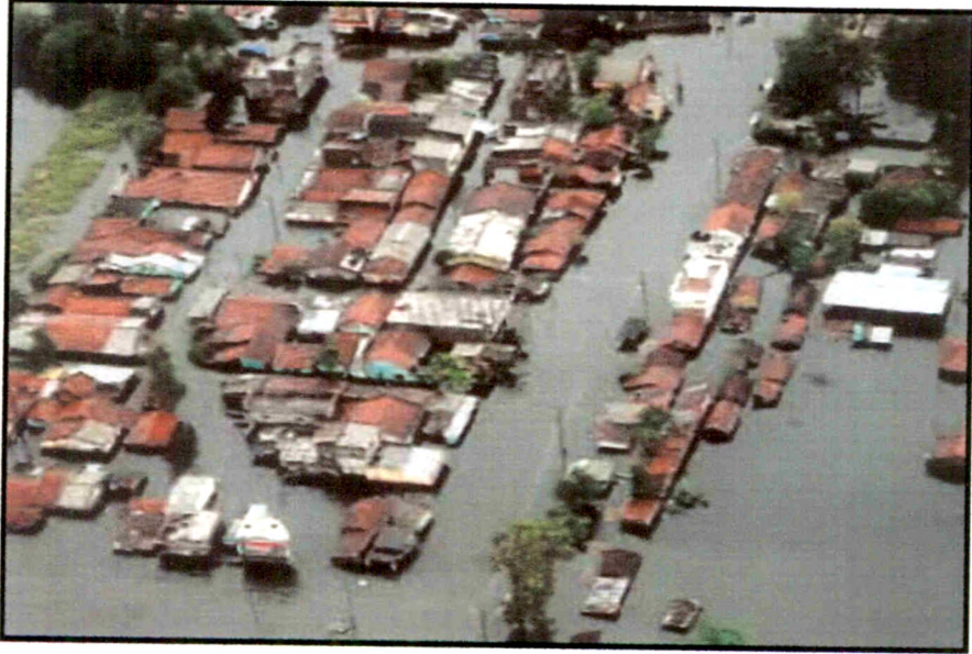
पूराच्या पाण्याने गावाला घातलेला वेढा