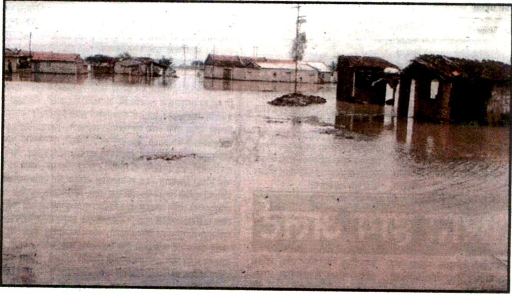
पुरामुळे झालेली घरांची पडझड