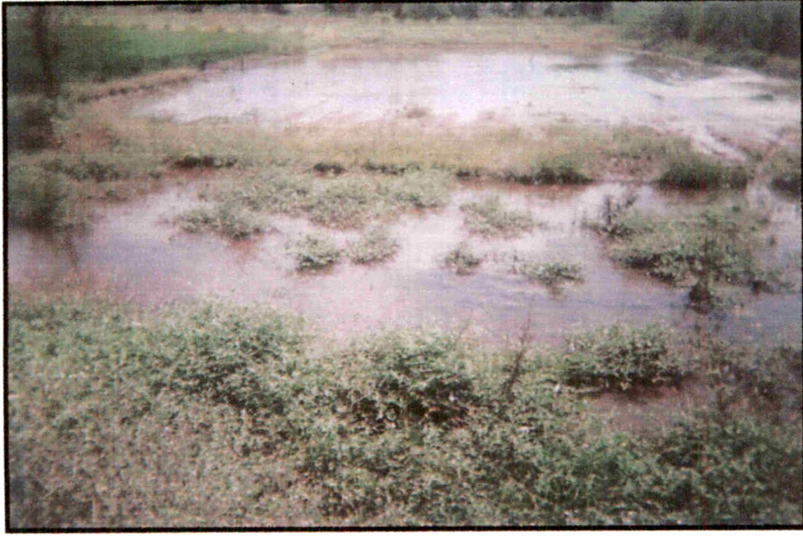
पुराच्या पाण्यामुळे शेतातील पीके कुजून झालेले नुकसान