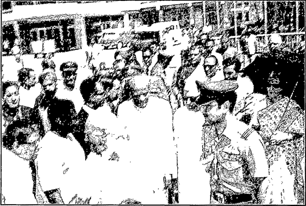
तत्कालीन राष्ट्रपती श्री. गिरी, तत्कालीन पंतप्रधान इंदिरा गांधी यांच्यासमवेत ना. आनंदराव चव्हाण.