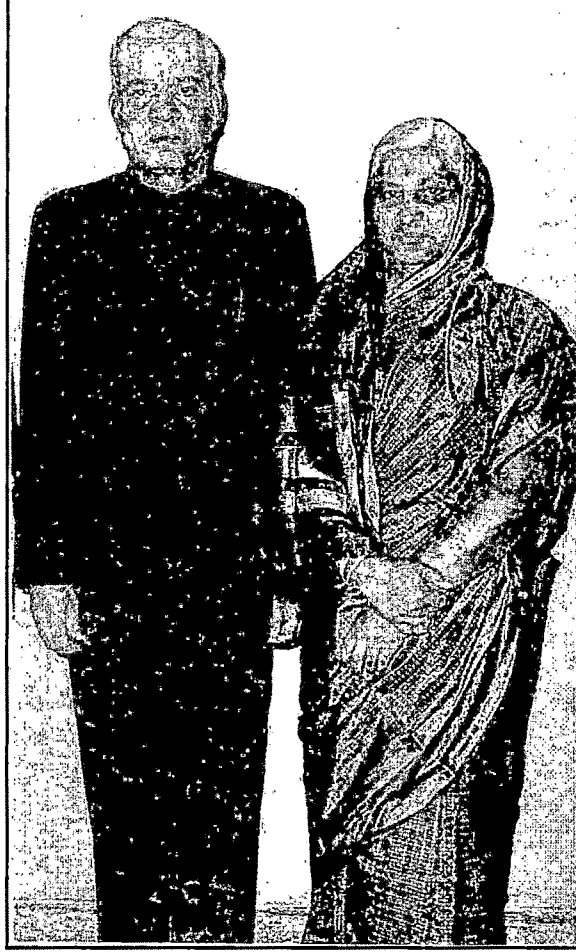
तत्कालीन केंद्रीय कायदा मंत्री ना. कै. आनंदराव चव्हाण आणि खा. श्रीमती प्रेमलाताई चव्हाण.