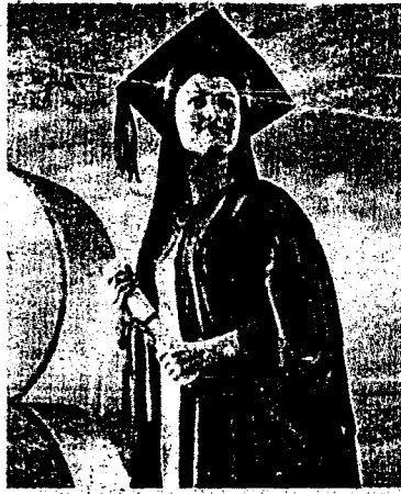
अण्णाभाऊ साठे विकास महामंडळ